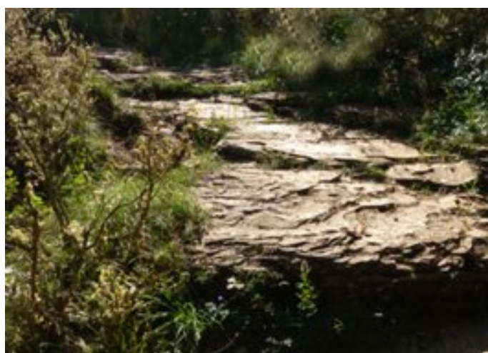
Descente sur strates de rocher.