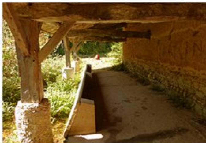
Le lavoir de Montcarra.