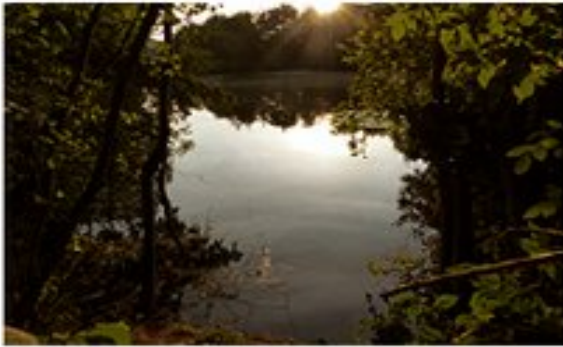
L'étang de Gole au petit matin.

Cette randonnée se déroule autour de Montcarra entre vallons et collines entourant ce village.