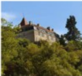
Le château Thomasset