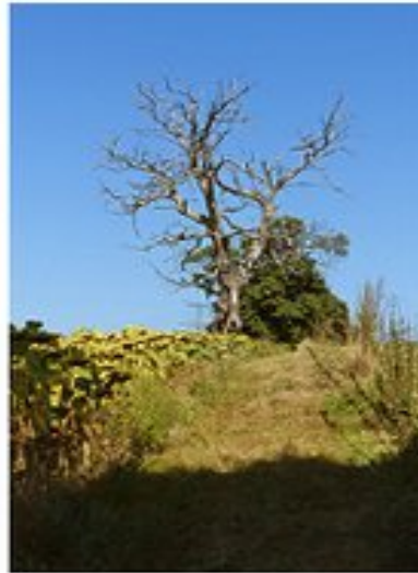
Sur les collines